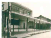
昭和29年 上町コミュニティセンター